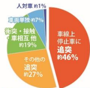
図：高速道路での類型別交通事故の割合（平成28年中）

平成28年中に高速道路で起きた交通事故のうち、車線上の停止車両に追突した事故が約46%と半数近くを占めていました(図)。低速で進んだりすぐに止まったりを繰り返す渋滞では、次第にドライバーの集中力が薄れ、ボーッとして注意を欠いた運転に陥りやすくなり、ブレーキを踏むタイミングが遅れて前車に追突する可能性があります。また、渋滞の最後尾に高速のまま追突すれば、重大な事故に至る危険性があります。