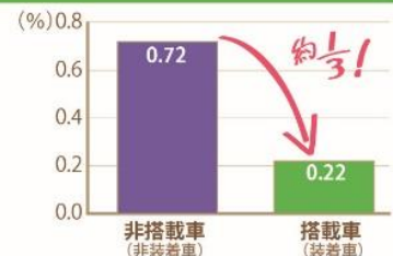
図1：自動ブレーキを搭載したトラックと非搭載のトラックの追突事故発生率の比較（2015年4月～2015年12月）

自動ブレーキは、予期せず作動したり、そもそも作動しなかったりするなど、システムは万能ではなく限界があります。ドライバーは自動ブレーキ搭載車を運転する前に、システムが作動する条件を十分に理解する必要があります。